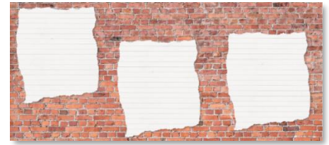
vragenmuur &amp; weetmuur

Vraag uw leerlingen wat zij de vorige les hebben geleerd. Bekijk samen met de leerlingen de vragenmuur en weetmuur. Op welke vragen hebben jullie al antwoorden gevonden? En op welke vragen hopen de leerlingen nog antwoord te krijgen? Bespreek tot slot de lesdoelen.