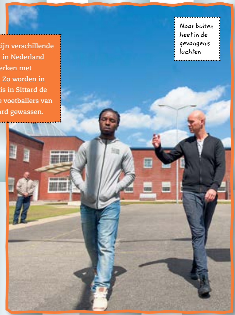
Naar buiten heet in de gevangenis luchten